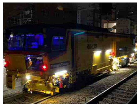
大型保守機械での軌道整備